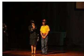
高槻市消防団 防火防災啓発劇「人形劇 消防団の木」発表